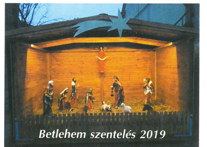
Betlehem szentelés 2019